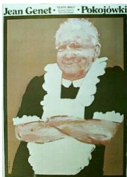
Jean Genet : les Bonnes Teatr Maly Affiche de Waldemar Swierzy, 1983

Avec des artistes comme Tomaszewski, Cieslewicz, Czerniawski, Eidrigevicius, Gorowski, Lenica, Mlodozieniec, Sadowski, Stankiewicz, Starowieyski, Swierzy, Pagowski, Olbinski, Walkuski,... Davantage ? Ne manquez pas la rencontre autour de l'affiche polonaise que vous proposent Céline Hersant et Maxime Lejeune.